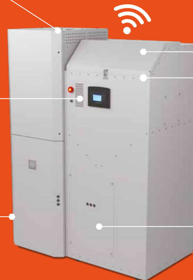
EMPLACEMENT POUR SYSTÈME D'ASPIRATION OU VIS SANS FIN