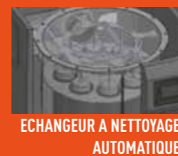
ECHANGEUR A NETTOYAGE AUTOMATIQUE