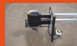
ENSEMBLE BRÛLEUR pot de combustion (démontage facile de l'ensemble)