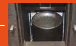
BRASIER HAUTE TEMPÉRATURE facilement démontable, inox très haute qualité